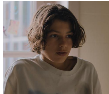
Abbildungen 1. & 2.